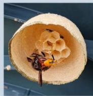
Embryonalnest nur mit Königin (März - Mai)