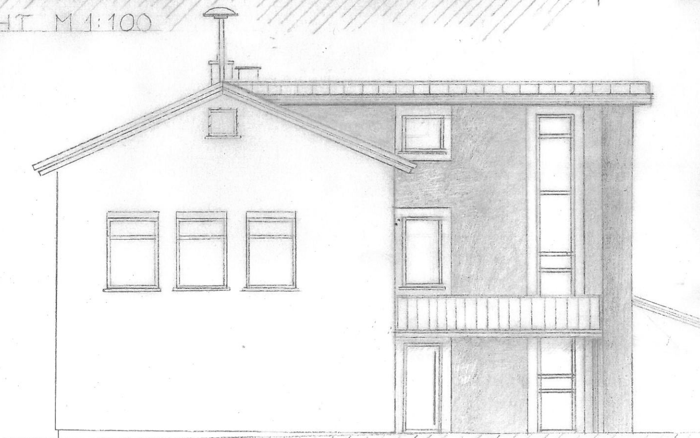
SÜDOSTANSICHT M 1:100

ÜBERARBEITUNG 16.10.20 BAUVORHABEN: UMBAU UND ERWEIT- UNG RATHAUS WEISSBACH BAUHERR: GEMEINDE WEISSBACH NIEDERNHALLER STR. 5, WEISSBACH BAUORT: NIEDERNHALLER STR. 5, FLURSTÜCK NR. 72 / 74677 WEISSBACH ÜBERARBEITETE ENTWURFSPLANUNG 102